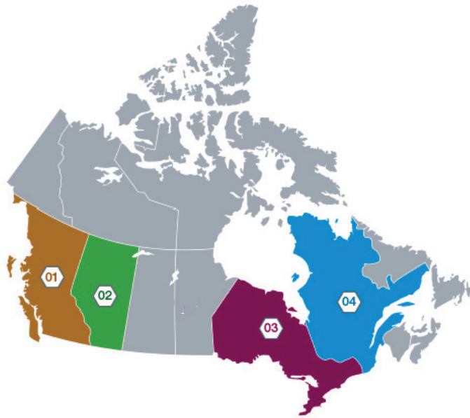
Figure 1. Sites RCCET ayant signalé la présence d'analogues du fentanyl

Le fluorofentanyl et le méthylfentanyl sont les analogues les plus détectés au pays; à noter toutefois que le carfentanil est encore détecté. Un lien a été établi entre la présence de ces analogues et une hausse du nombre d'intoxications.